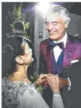
Bocelli con Carla Fracci a Lajatico